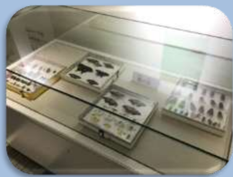
3階イベントホール前で夏の虫の標本を展示しています。