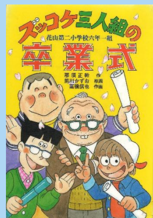
『ズッコケ三人組の卒業式』 さんじんぐみ そつぎょうしき な すまさもと さく 那須正幹／作 まえかわ げんが 前川かずお／原画 まえかわすみ え 前川澄枝／キャラクター監修 たかはししんや さくが 高橋信也／作画 ポプラ社 (K91 ナ)