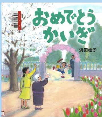
『おめでとうかいぎ』 はまだけいこ さく 浜田桂子／作 りろんしゃ 理論社 (Eオ)