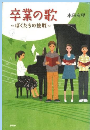
そつぎょう うた 『卒業の歌』 ほんだ ありあけ ちょ 本田有明／著 びーえいちびーけんきゅうじよ P H P 研究所 (K91 ホ)